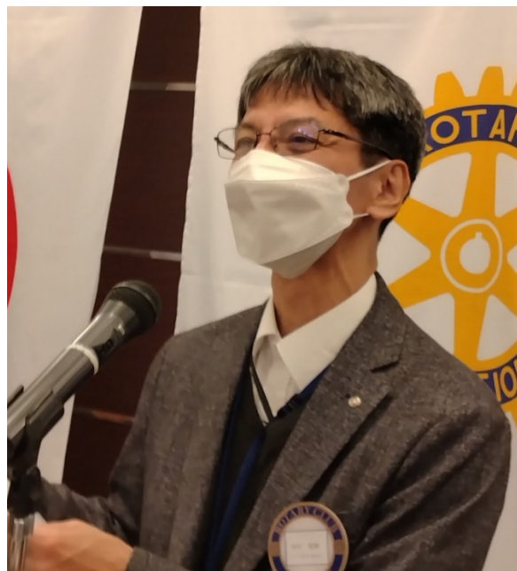
田中地区インターアクト委員